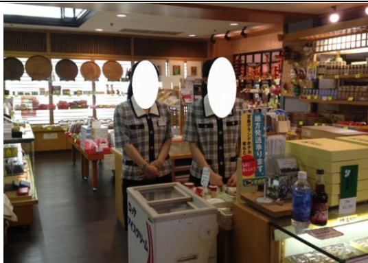
飯店內賣店(實習場所之一)